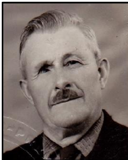
Aristide AUDOUIN 1902/1976