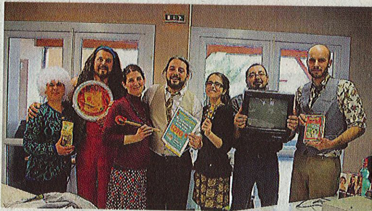
Les membres du bureau costumés ont imaginé une mise en scène débridée.

L'association Taptapo'Sambalek a réuni ses adhérents pour